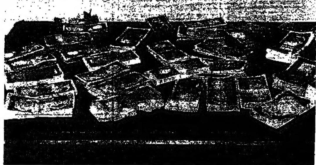
المجال التي استمرت نتيجة احتشاق المركة التي حدث في احدى المؤسسات بيمان « التفاصيل على الصفحة الثانية - »